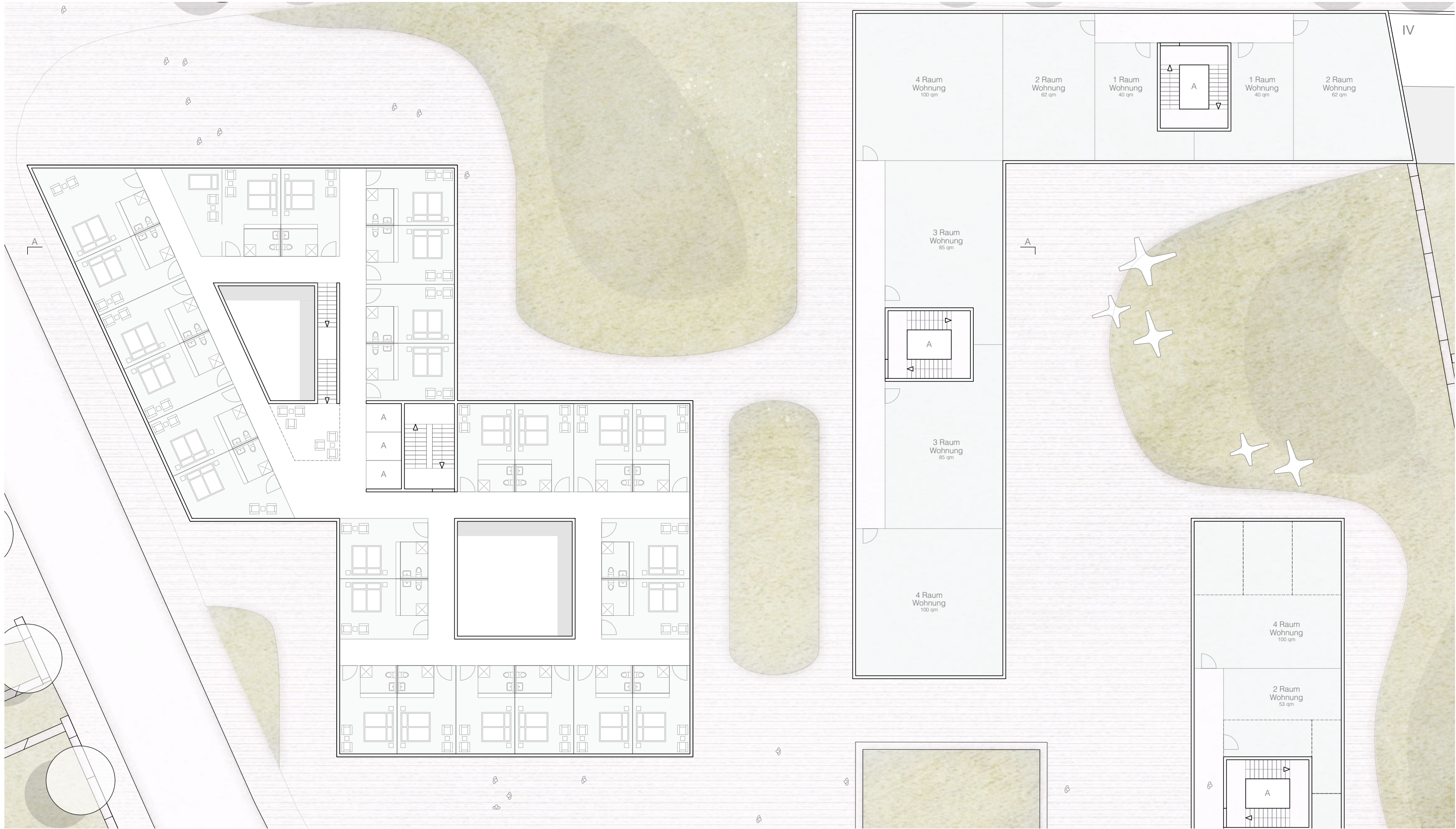
Grundriss Regelgeschoss (Obergeschoss) 1:250