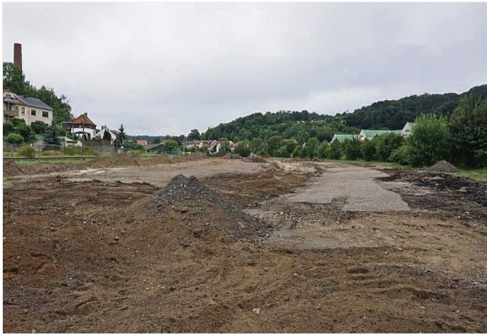
Aus der Brache wird bald ein neuer grüner Freiraum für Groß und Klein.

nimmt die LLB GmbH - Garten- und Landschaftsbau Dresden. Vorangegangen waren dem Baustart ein umfassender fachlicher Austausch und eine breite Bürgerbeteiligung. So hatten bereits 2017 junge Landschaftsarchitekten im Rahmen des „Peter-Joseph-Lenné-Preises“ ihre Konzepte für das Areal eingereicht. Diese wurden im Rahmen einer Ausstellung im Rathaus vorgestellt. Diskutiert wurde das Vorhaben außerdem im Rahmen verschiedener Bürgerveranstaltungen, etwa bei einem Bürgerrundgang mit anschließendem Gespräch im Herbst 2018.