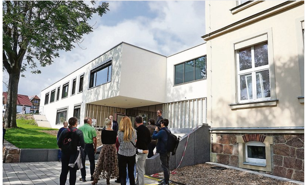
Stadträte und Medienvertreter informierten sich gemeinsam mit dem OB zum aktuellen Baustand.

Sportlich aktiv werden können die Schülerinnen und Schüler so-