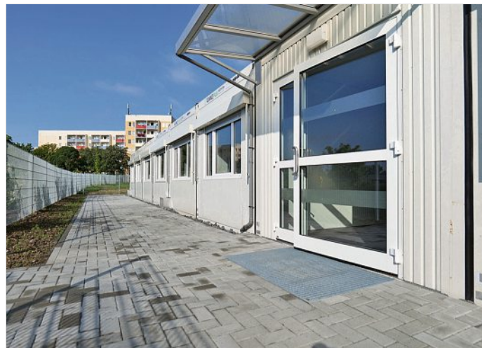
Außen minimalistisch, innen modern und gemütlich - die Außenstelle der Questenbergschule am Aritaring.

In vier Klassenräumen bietet die Anlage Platz für rund 120 Grundschulkindern und -schüler. Außerdem wird auch die Hortbetreuung für die Questenberg-