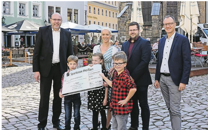
Die Gewinner des Energiesparwettbewerbs.