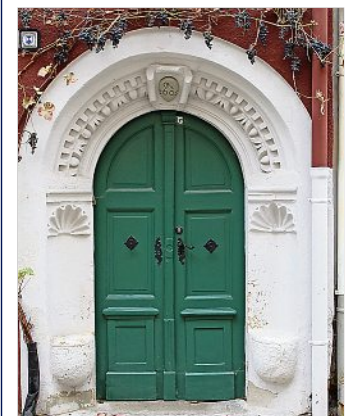
Was ist das und wo ist es zu sehen?

Für die Stadt Meißen und ihre Einwohner wünsche ich mir, dass es weiter gelingt, die Stadt und ihr Umfeld auch für Familien und junge Menschen attraktiv zu gestalten, um die Möglichkeit zu haben, altes zu bewahren und neues zu gestalten.