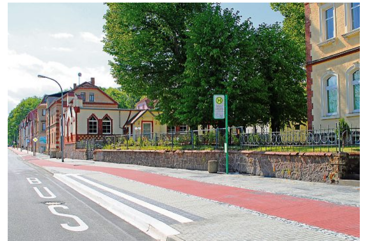
Der 2020 fertiggestellte Radweg an der Heinrich-Heine-Straße.

„Es wäre toll, wenn sich viele Meißnerinnen und Meißner an der Umfrage beteiligen“, so Verkehrsplaner Anatoly Arkhipov. „Aussagekräftige Ergebnisse helfen uns, solide Datengrundlagen zum städtischen Radverkehr zu gewinnen und Handlungsschwerpunkte für die kommenden Jahre zu setzen.“