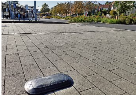
Neue Parksensoren am Parkplatz Busbahnhof.

Die Zahl der mit Parksensoren ausgestatteten Park+Ride-Plätze im Verkehrsverbund Oberelbe (VVO) wächst auf 13. Fahrgäste können nun auch für die beiden P+R-Anlagen in Meissen-Triebischtal und am Meißner Bahnhof online prüfen, ob noch Plätze frei sind. Der VVO hat rund 41.000 Euro in die Technik investiert.