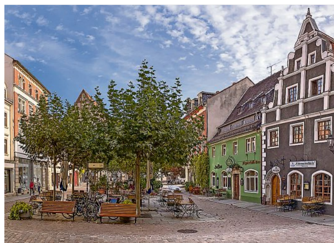
Der Kleinmarkt heute.