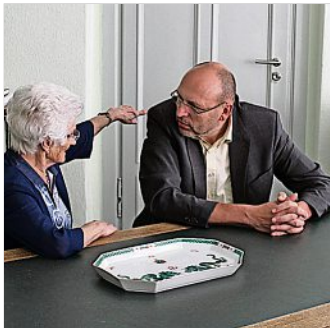
OB Olaf Raschke bittet am 3. November wieder zur Bürgersprechstunde.

Die nächste OB-Sprechstunde findet am 3. November, von 15 bis 17 Uhr, im Rathaus, Markt 1, statt. Interessierte Bürger melden sich bitte unter der Rufnummer 03521-467206 im Sekretariat des Oberbürgermeisters unter Nennung ihres Themas an.