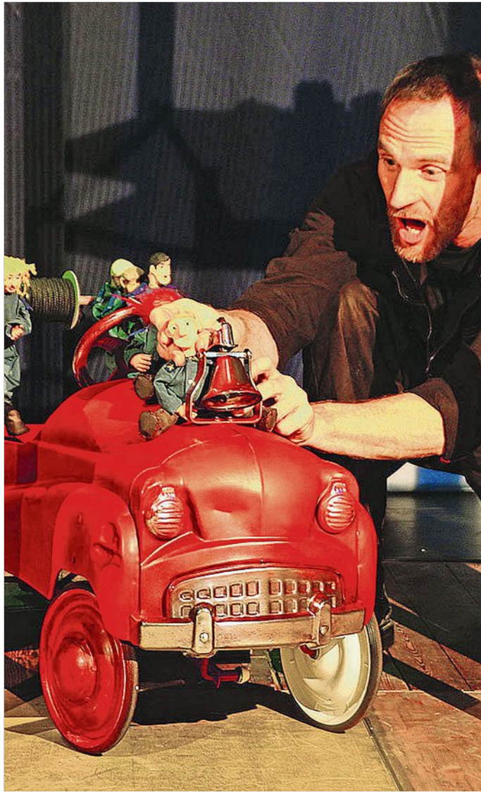
Bei der Feuerwehr wird der Kaffee kalt.

■ Sa., 7. Nov., 13 und 14.30 Uhr Präsentation zum Tafelaufsatz Schwanenservice, Porzellan-Manufaktur Meissen