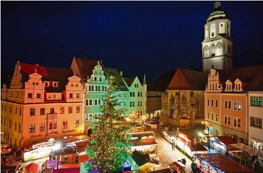
Blick auf die weihnachtlich geschmückte Altstadt.