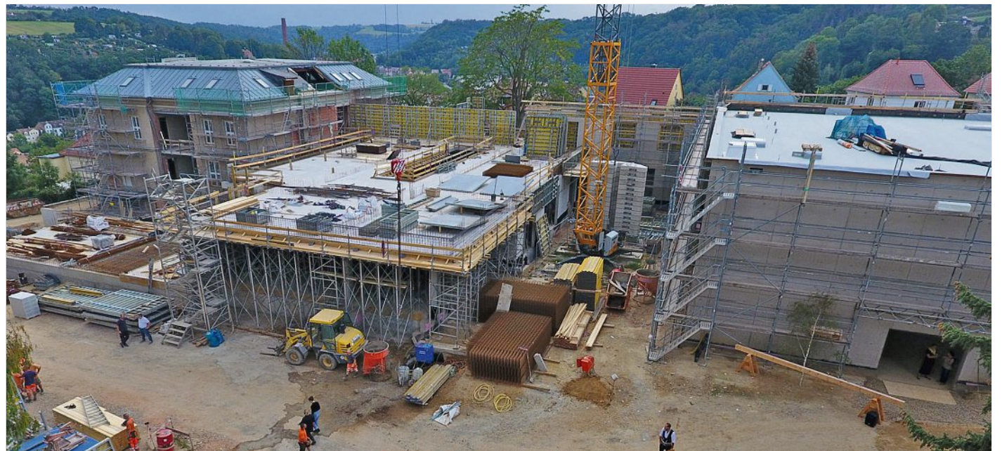
Drohnenansicht der Questenberg-Grundschule am Tag des Richtfestes.