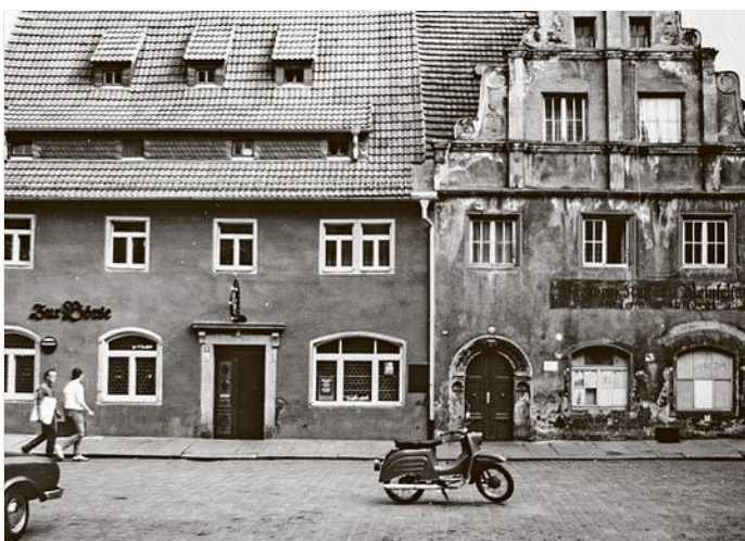
Blick auf den Kleinmarkt vor 1990.