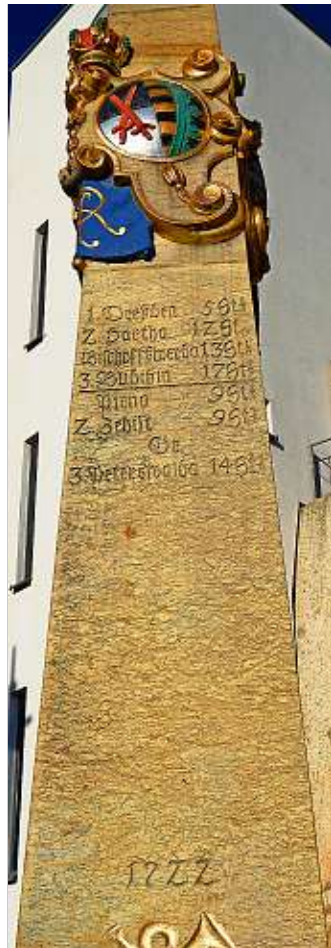
Was ist das und wo ist es zu finden?