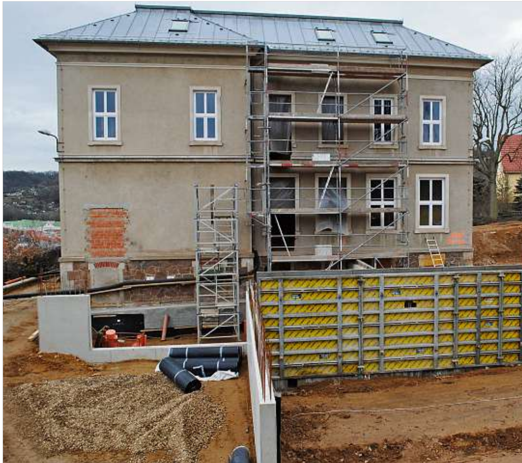
Blick auf einen Teil der frisch geschalteten Kellerwände des neu zu errichtenden Schulgebäudes.

In nächster Zeit steht das Gießen der 30 Zentimeter starken Bodenplatte für die Turnhalle an, für 657 Quadratmeter Fläche werden gut 240 Kubikmeter Beton benötigt. Darüber hinaus