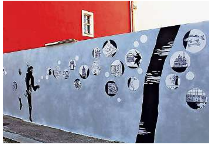
Mit Fördermitteln aus dem Verfügungsfonds umgesetzt: das Wandbild in der Görnischen Gasse.