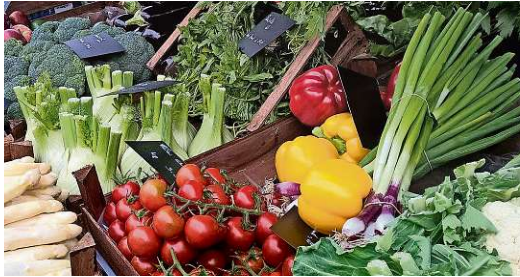
Wieder mit im Angebot: frisches Obst und Gemüse auf dem Grünmarkt.

Eingefleischte Grünmarktfans freuen sich sicher schon jetzt auf die frischen Angebote der Markthändler, wie zum Beispiel „Hein-Mück“, dem „Marktfahrrad“, Gartenbaubetrieb Hecht, der Mergendorfer Fleischwaren oder der Imkerei George. Auch