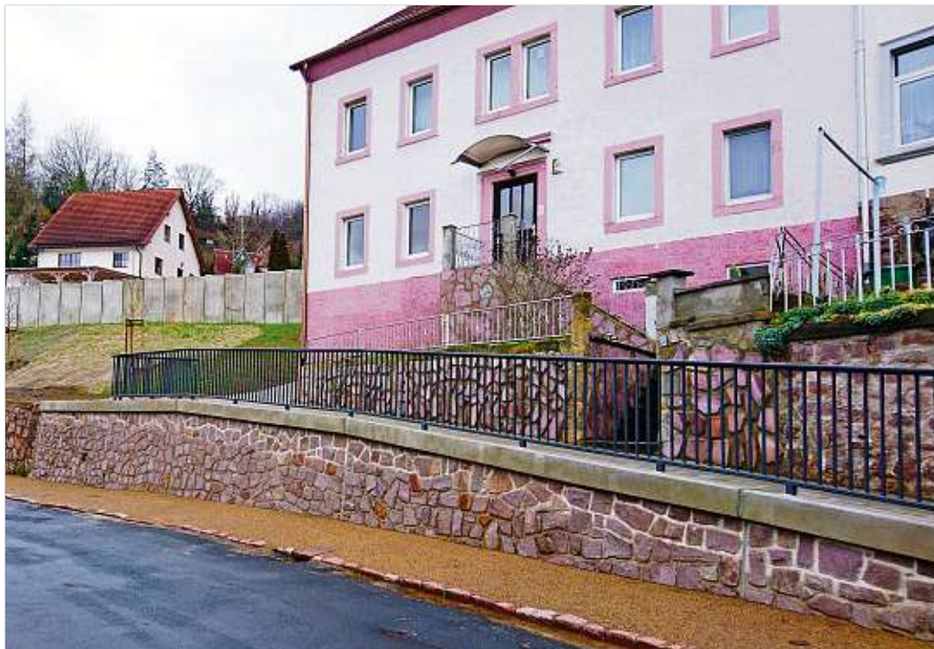
Im Bereich Mühlweg/Sonnenleite wurde kürzlich der erste Bauabschnitt der Instandsetzungsarbeiten an den Stützmauern abgeschlossen.

Im Vorfeld der Sitzung trafen sich die Ausschussmitglieder mit Mitarbeitern des Baudezernates vor Ort zu einer gemeinsamen Bemusterung der Pflasterflächen in der Görnischen Gasse. Zum weiteren Vorgehen bezüglich der Entwurfsplanung in Sachen Straßenbau, Beleuchtung und Möblierung einigten sich die Räte auf den Vorschlag des Stadtbauamtes, die Ergebnisse und Hinweise aus der Bemusterung in die entsprechende Beschlussvorlage aufzunehmen und in die Stadtratssitzung am 25. März 2020 einzubringen. Anregungen seitens der Räte waren unter anderem: eine optimierte Bauweise des geplanten Streifens, der zur Verkehrsberuhigung und einer besseren Nutzung durch Fahrradfahrer sowie zur Barrierefreiheit beitragen soll, der Schutz des Erkers in der Einmündung Ecke Jüdenberg sowie im Bereich der Engstellen nach dem Hundewinkel die Beleuchtung über Ausleger an den Gebäuden zu sichern. Ebenso soll vom Ordnungsamt geprüft werden, inwieweit eine vom Umweltbundesamt empfohlene Aufpflasterung umsetzbar ist.