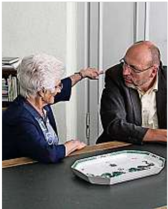
OB Olaf Raschke bittet am 3. März zur Bürgersprechstunde.

Jeden ersten Dienstag im Monat führt Oberbürgermeister Olaf Raschke eine Bürgersprechstunde durch. Die Gespräche mit den Bürgern sind für ihn ein wichtiger Teil seiner Amtsgeschäfte. Bürger können im persönlichen Gespräch Anliegen, Wünsche und Probleme vorbringen. Die nächste OB-Sprechstunde findet am 3. März, von 15 bis 17 Uhr, im Rathaus, Markt 1, statt. Interessierte Bürger melden sich bitte unter der Rufnummer 03521-467206 im Sekretariat des Oberbürgermeisters unter Nennung ihres Themas an.