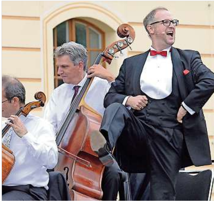
Am Freitag, dem 15. Februar ab 19.30 Uhr, gibt die Elbland Philharmonie Sachsen unter dem Titel „Karneval und Maskenball“ ein Faschingskonzert im Theater Meissen.

Bee Gees Show – Jive Talkin, Eine Reise in die Zeit des Disco