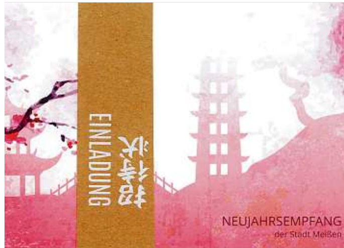
Details der Einladungskarten für den „japanischen“ Neujahrsempfang der Stadt.

Ebenso wichtig für die Städtepartnerschaft sind die vielen persönlichen Kontakte zwischen Arita und Meißen. Sie sind geprägt von aufrichtigem Interes-