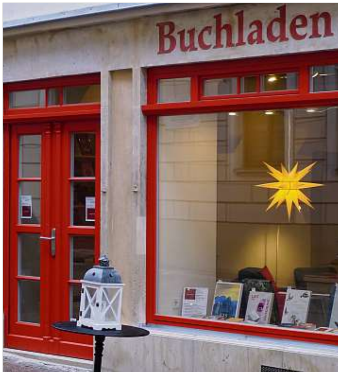
Der Buchladen Köster in der Burgstraße 23.

Jens Köster: „Im September gelang uns mit Hilfe lokaler Handwerker die Einrichtung des Ladens fast in Rekordzeit, unmit-