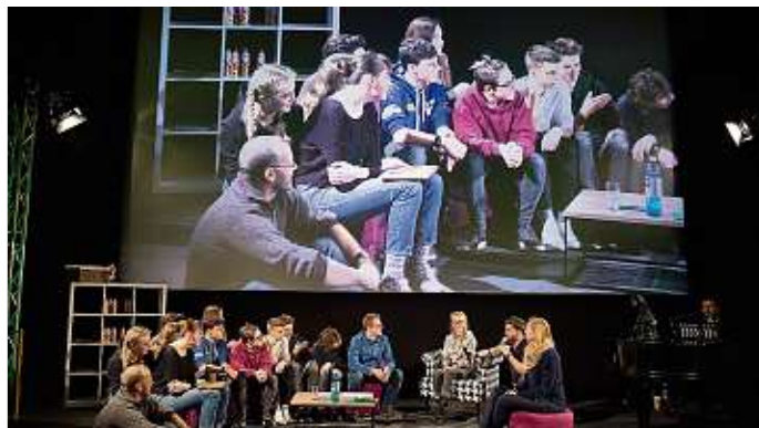
Das Gewinner-Team bei der Preisverleihung.

Die Schüler erstellten eine Reportage, die darüber berichtet, dass ein neues Medikament zur Steigerung der Leistungsfähigkeit an den Schülern der Freien Werkschule getestet wurde. Die Reportage wurde anschließend als Tatsachenbericht im Lokalfernsehen gesendet und online