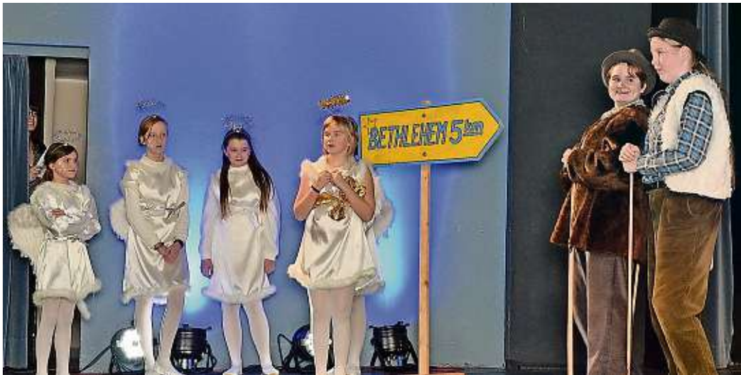
Vor rund 200 Gästen zeigten Kinder der Arche Meißen ihre Weihnachtsaufführung.