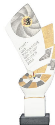
Der Kunst- und Kulturpreis.