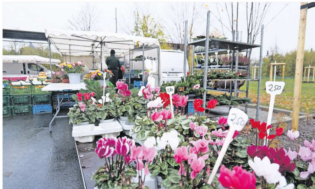
Auf dem neu gestalteten Wochenmarktgelände haben die Händlerinnen und Händler umfangreiche Möglichkeiten, ihre Waren zu präsentieren.

Das Gelände wurde grundlegend neu strukturiert, Wege- und Fahrbahnbeziehungen an-