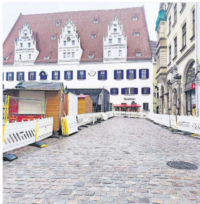
Das erneuerte Pflaster auf dem Markt.

Das vorhandene Wildpflaster wurde ebenso wie die Granitplatten vom Gehweg aufgenommen und im Bauhof zwischengelagert. Anschließend wurde im Straßenbereich Granitkopfsteinpflaster mit vollgebundener Verfüguung verlegt. Die aufgenommenen Granitplatten haben