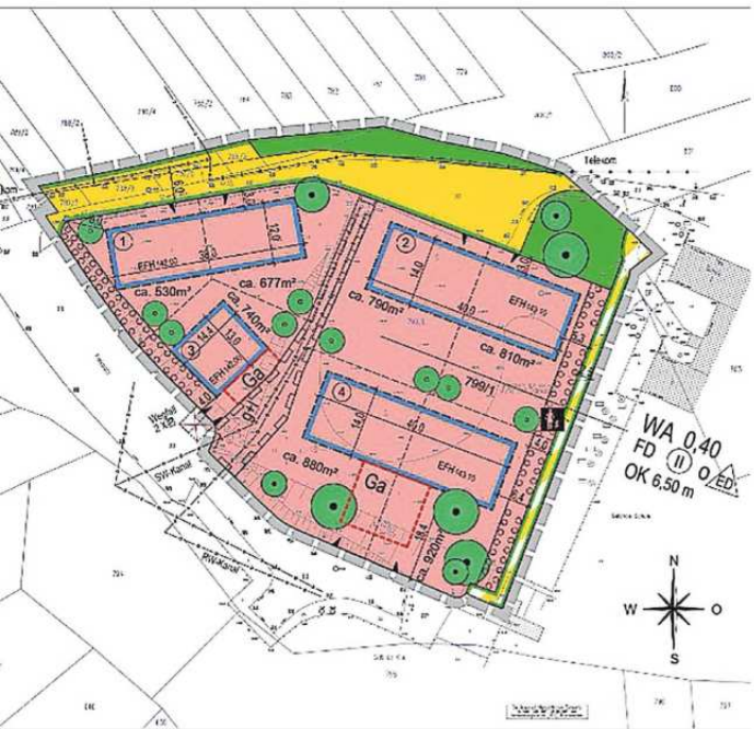
Planausschnitt räumlicher Geltungsbereich Bebauungsplan „Wohngebiet Kalkberg“