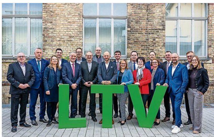
Gemeinsam stark für den Tourismus in Sachsen: Die Mitglieder des Landestourismusverbandes haben einen neuen Vorstand gewählt

Weitere Informationen zum Projekt sind abrufbar unter https://tu-dresden.de/bu/umwelt/forst/dia-wald