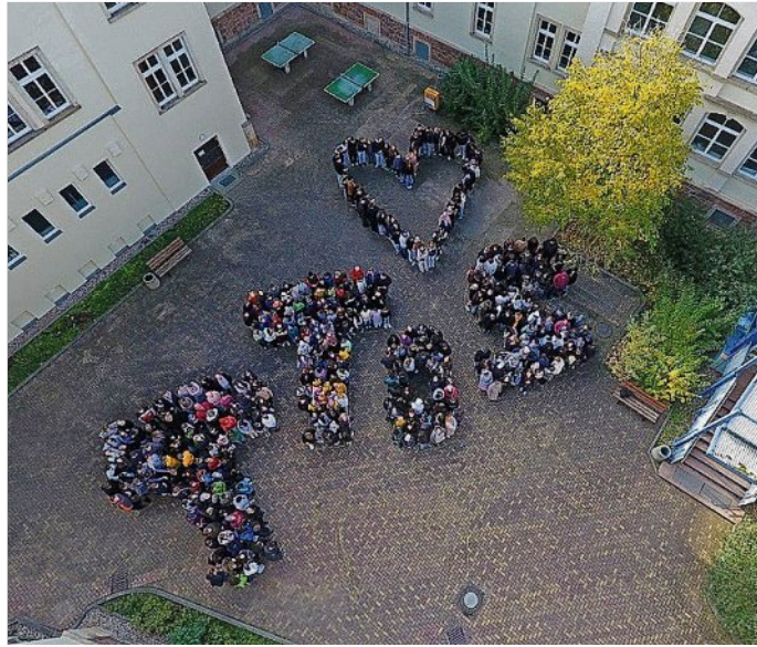
Zur Feier der Übergabe formten die Schülerinnen und Schüler die Schulinitialien im Innenhof.

Für den Chemieunterricht steht nun außerdem ein weiteres modernes Fachkabinett zur Verfügung.