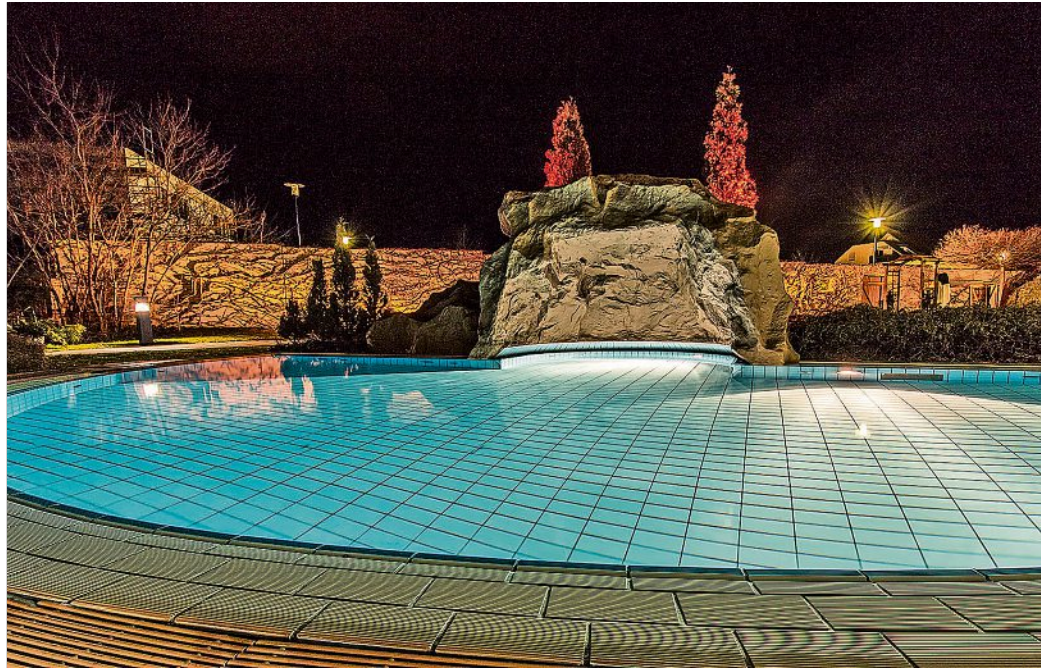
Die Saunalandschaft im Meißner Wellenspiel ist eine Oase für Gesundheit.

Kein Wunder, dass die Saunalandschaft im Wellenspiel inzwischen viele Liebhaber gefunden hat. Sie alle schätzen die positive Wirkung der Sauna auf den ganzen Körper und besonders auf das Immunsystem. Wie wissenschaftliche Studien ergeben haben, leiden regelmäßige Saunagänger seltener unter Erkältungen. Grund hierfür ist vor allem das Wechselspiel zwischen Wärme und Kälte beim Saunabaden. Neben der Haut werden so hauptsächlich die Schleimhäute im Nasen-Rachen-Raum auf plötzliche Temperaturveränderungen besser vorbereitet. Die Sauna wirkt sich außerdem positiv auf das Herz-Kreislauf-System aus. In der trockenen Wärme erweitern sich die Blutgefä-