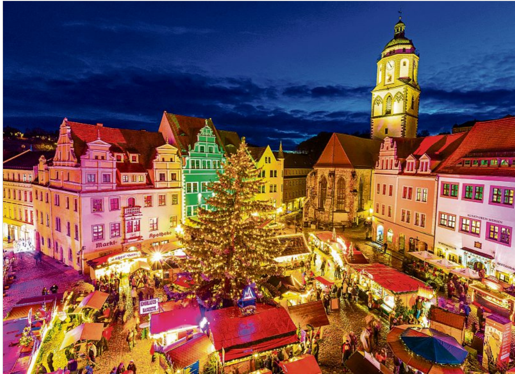
Lädt schon bald wieder zu buntem Treiben ein: Meißner Weihnacht