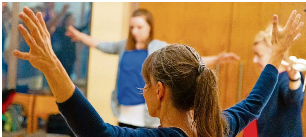
Heileurythmie und Tai Chi waren zwei Workshops beim Gesundheitstag der Diakonie Meißen.