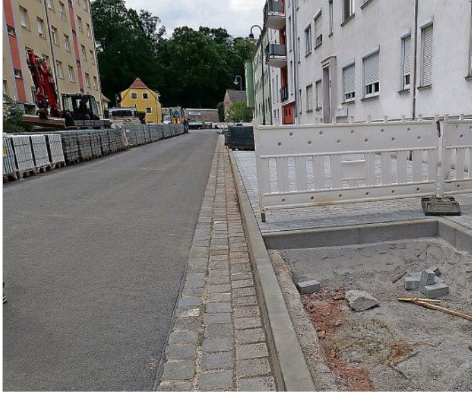
Künftig finden auf der Wolyniezstraße sechs Feldahorne in den neu angelegten Baumquartieren Platz.

Im Zuge der Erneuerung der Wolyniezstraße haben die Meißner Stadtwerke die Trinkwasserlei-