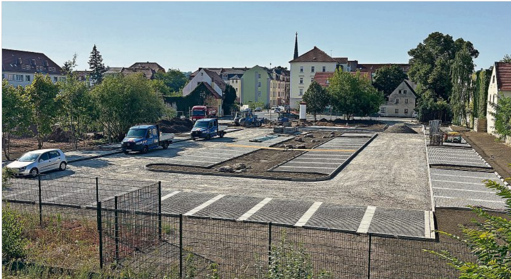
Die Arbeiten auf dem Areal des Wochenmarktes schreiten voran. Die Fertigstellung ist für November vorgesehen.

„Mit der Umgestaltung des Areals realisieren wir eine Schlüsselmaßnahme für eine verbesserte Lebens- und Aufenthaltsqualität im Stadtteil Cölln. Die Instandsetzung der Parkplätze und des Wochenmarktgeländes wird zu 100 Prozent durch die Ausgleichsbeiträge aus dem Sanierungsgebiet „Meißen - Cölln“ finanziert. Damit entsteht hier, von Meißnern für Meißner, ein für alle Generationen nutzbarer Ort“, so der Oberbürgermeister. Bis voraussichtlich November 2024 wird das 5.200 qm große Areal neu strukturiert und