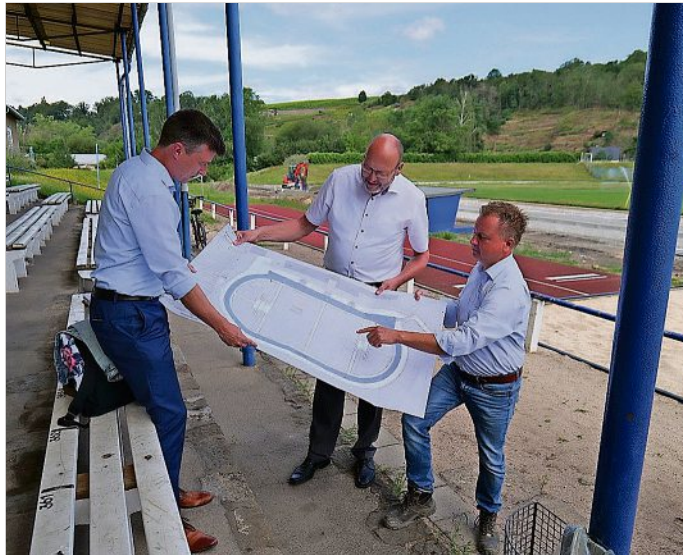
Mitte Juli war die Sanierung der Laufbahn in vollem Gange.

„Mit der Sanierung tragen wir ein Stück mehr der großen Sportbegeisterung der Meißnerinnen und Meißner Rechnung. Das Bund-Länder-Programm zur Sportstättenförderung ermöglicht es uns, eine komplett neue Anlage für die Meißner Leichtathletik zu schaffen“, sagt Oberbürgermeister Olaf Raschke. Meißens Bürgermeister Markus Renner selbst hatte sich um Fördermöglichkeiten für die Laufbahn bemüht. Für ihn ist die Sanierung der Laufbahnen eine Herzensangelegenheit. „Seit Jahrzehnten kennen wir die alten Aschbahnen im Stadion. Nun sorgen wir nicht nur für optimale Trainings- und Wettbewerbsbedin-