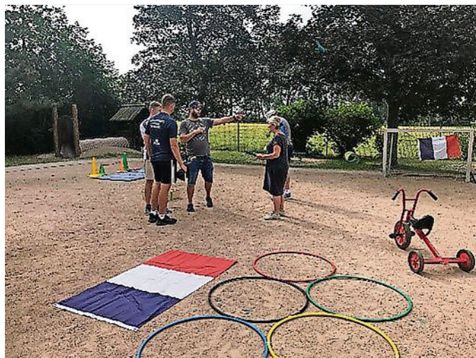
Städtepartnerschaftsverein Meißen e.V. und die Kita Nassaumücken bei der ersten Meißner Olympiade.