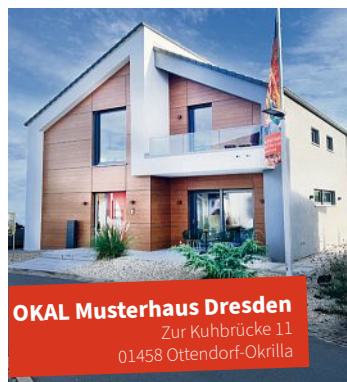
OKAL Musterhaus Dresden Zur Kuhbrücke 11 01458 Ottendorf-Okrilla

da. Telefon in der Sprechzeit: 0174 6084257. Anmeldungen vorab bitte an: post@friedensrichter-meissen.de