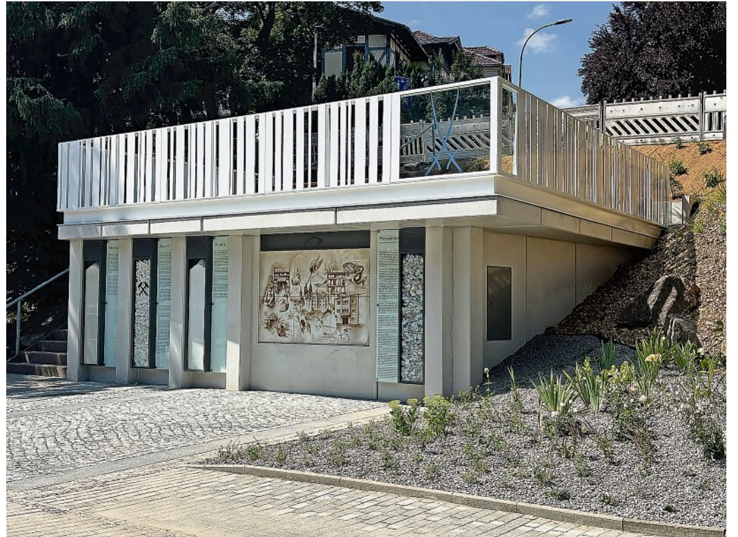
Anfang Juli erfolgte die Freigabe der Schaufläche der Porzellan-Manufaktur Meissen.

Die Erlebniswelt MEISSEN erhält mit der Porzellan-Schaufläche eine weitere Sehenswürdigkeit, welche diese Königsklasse des Kunsthandwerks nun auch außerhalb erlebbar macht. Die Stadt Meißen setzt damit einen neuen Meilenstein in der weltweit einzigartigen Porzellangeschichte der Stadt.