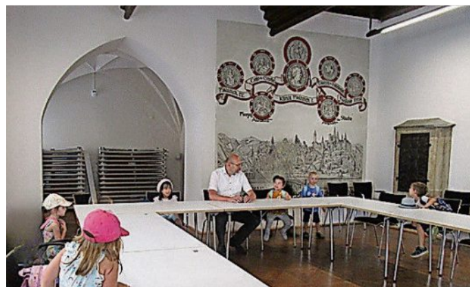
Kinder der Kita Sonnenschein im Gespräch mit Oberbürgermeister Olaf Raschke.