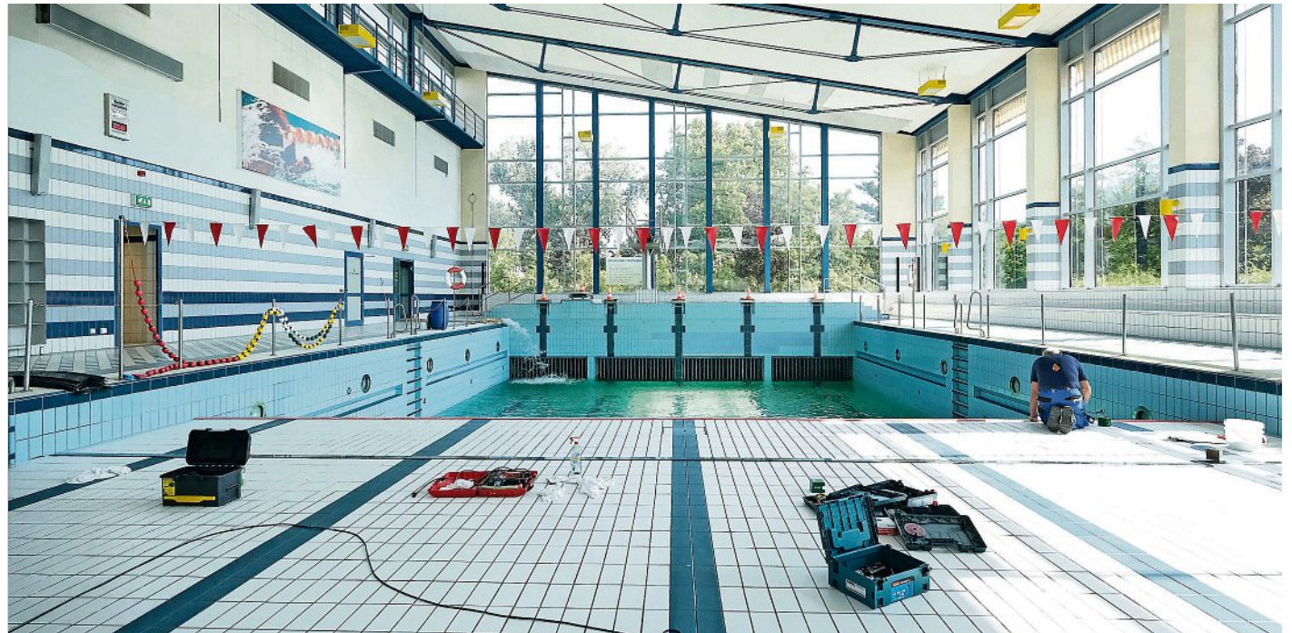
Ein Mal im Jahr wird das Wellenspiel vom Freizeitbad zur Baustelle. Seit 12. August läuft der Betrieb wieder.

Ebenso ging es um die Weiterführung der energieoptimierenden Maßnahmen, zum Beispiel mit der Erneuerung der Wärmetauscher, der LED-Beleuchtung im Solebecken. Maler- und Fliesenarbeiten sowie Klempnerarbeiten gehörten zum Pro-