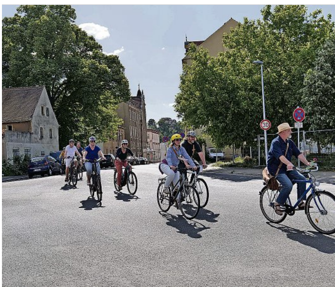
Bürgermeister Markus Renner sowie Vertreterinnen und Vertreter des Meißner Stadtrates bei der offiziellen Radwegfreigabe in der Brauhausstraße.

Offizielle Freigabe der Brauhausstraße für den gegenläufigen Radverkehr