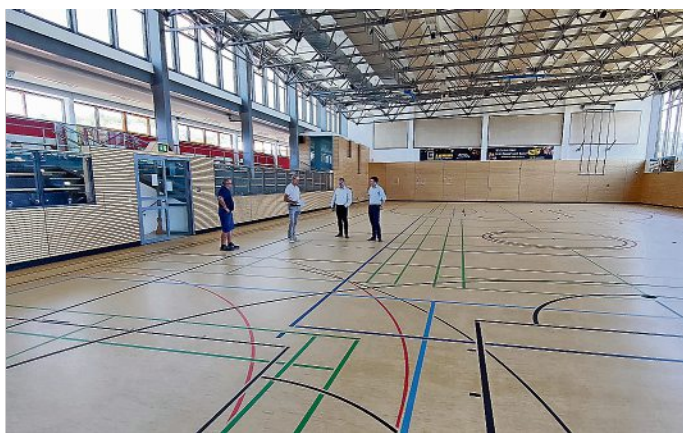
Bürgermeister Markus Renner macht sich ein Bild vom erneuerten Boden in der Turnhalle im Stadion Heiliger Grund.

Die Maßnahme wird über das Förderprogramm Investitionspakt zur Förderung von Sportstätten (IVP-Sport) in Höhe von 90 Prozent der zuwendungsfähigen Kosten gefördert. Die Mitfinanzierung erfolgt durch Steuermittel auf der Grundlage des vom Sächsischen Landtag beschlossenen Haushaltes. Die Mitfinanzierung erfolgt durch den Bund und den Freistaat Sachsen.