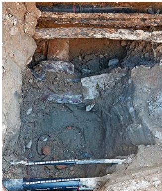
Leitungsgraben im Zuge einer Hausanschlussverlegung.

und Finanzierung derart komplexer Gemeinschaftsmaßnahmen ist wirtschaftlich und verkehrsorganisatorisch geboten und besitzt auch weiterhin in der aktuellen, wie auch künftigen Investitionsplanung des Anfang 2022 gegründeten Eigenbetriebes oberste Priorität. So finden auch die laufenden Gemeinschaftsmaßnahmen an Staats- und Gemeindestraßen, etwa an der Wilsdruffer Straße und der Wolyniezstraße im 2. Halbjahr, unter Einbeziehung der vom EAW beauftragten Teilleistungen an den Kanalanlagen, ihre planmäßige Fortsetzung. Die im Zusammenhang mit der Fahrbahnerneuerung an der B6 unvermeidbare Vollsperrphase im Sommer wird genutzt, um im Bereich der Hochuferstraße zwischen Altstadtparkplatz und Elbkai die Straßenquerung für zwei große Schutzrohre zu realisieren, welche für den Betrieb eines mobilen Hochwasserpumpwerks benötigt werden.