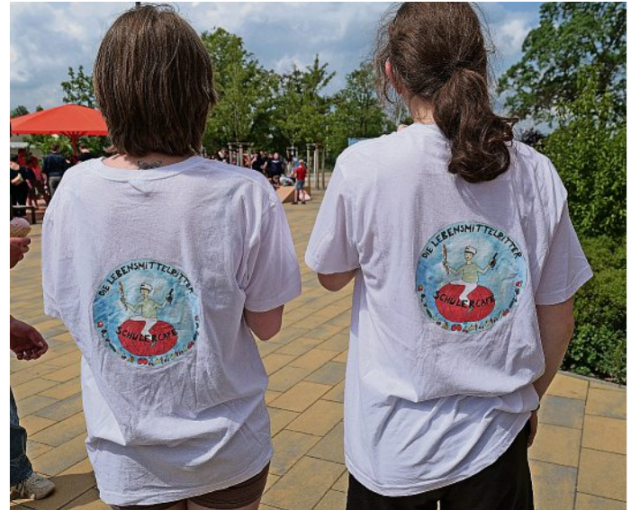
Auch witzige Marketingideen, wie selbst gestaltete T-Shirts, machen das Schülercafé zu etwas Besonderem.