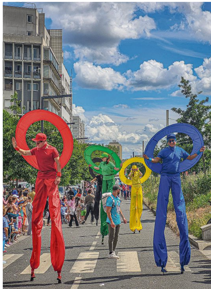
Die Parade anlässlich des Fliederfestes gab bereits einen kleinen Vorgeschmack auf die diesjährigen Olympischen Spiele in Paris.