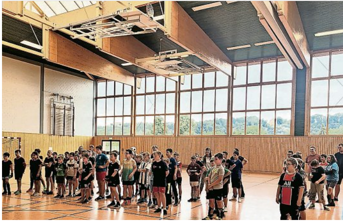
Grundschüler spielen gemeinsam Fußball