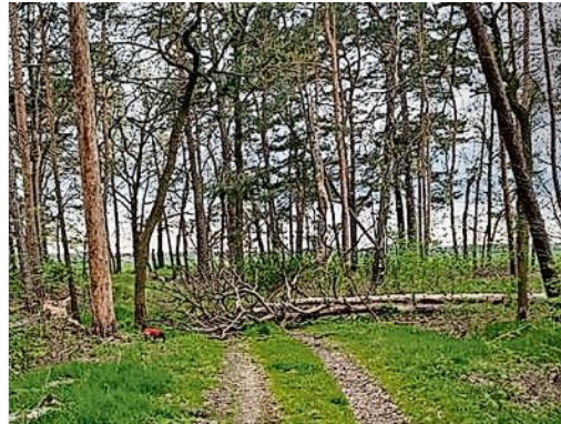
Pflegerückstände in den Wäldern führen zu einer erhöhten Brandlast und erschweren die Brandbekämpfung

Die Mitgliedschaft in der Forstbetriebsgemeinschaft kostet 20 Euro + 1 Euro je Hektar und Jahr und bringt keine regelmäßigen Verpflichtungen mit sich. Der Verein hat das Ziel, seinen Mitgliedern wirtschaftliche Vorteile im Bedarfsfall zu ermöglichen – zum Beispiel bei der Pflanzen- und Materialbestellung oder durch die Bündelung von Dienstleistungen zur Waldpflege sowie das Einwerben von Fördermitteln. Alle Eigentumsgrößen sind