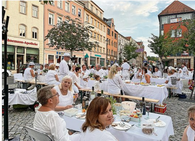
Eindruck vom Dinner in Weiß auf der Neugasse

Mit dem neunten Dinner wollen wir den Sommer feiern; uns wieder begegnen und neue Bekanntschaften knüpfen; unsere charmante Stadt mit fröhlichen Menschen schmücken und beleben. Es darf sich jeder eingeladen fühlen, der einen lockeren, freundlichen und besonderen Abend erleben und mitgestalten möchte. Mit guter Laune, guten Freunden und einem gewissen Stil wollen wir auch in diesem Jahr gemeinsam ein tolles Fest im Stadtpark an der Nikolaikirche feiern. Die Pforte der Nikolaikirche wird extra für unser „Dinner in Weiß“ zur Besichtigung geöffnet sein. Die Besonderheit des Open Air Picknick besteht darin, dass eine Teilnahme nur in weißer Kleidung möglich ist und jeder Gast selber für sein kulinarisches Wohl zu sorgen hat. Zum Gelingen des