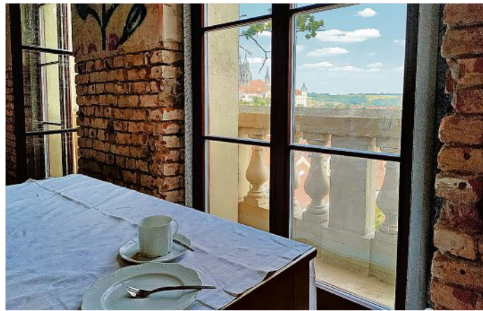
Traumhafte Aussicht aus der Galerie der Jahnhalle

Die Jahnhalle kann sich von außen wieder sehen lassen: Die frische Fassade glänzt und die restaurierten Fenster geben den Blick frei auf die Dächer der Stadt.