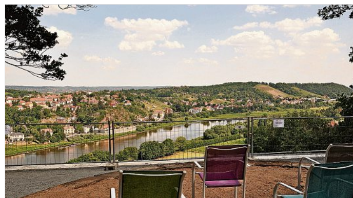
Blick auf und von der Aussichtsplattform im Katharinenpark

Im Jahr 2012 erwarb die Katharinenhof GmbH nach langem Leerstand die nun ruinöse Bau-