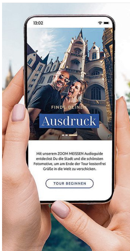
Oberfläche der ZOOMMEISSEN-App