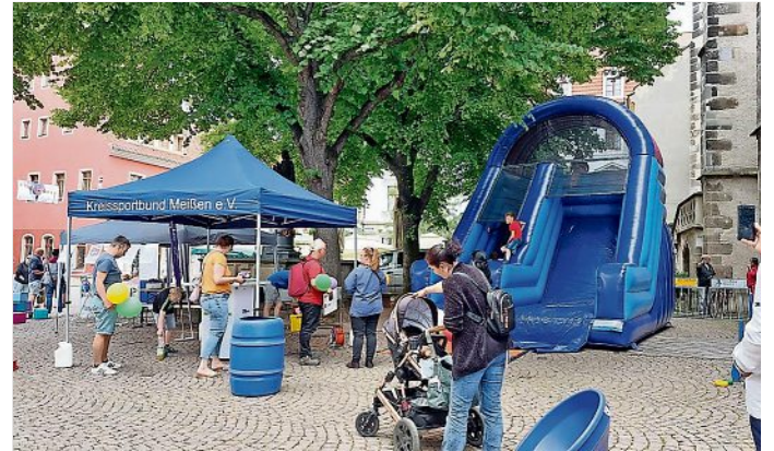
Impressionen vom Tag des Glücks