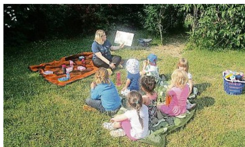
Genießen das Vorlesen: Kinder des Kindergarten Sonnenschein