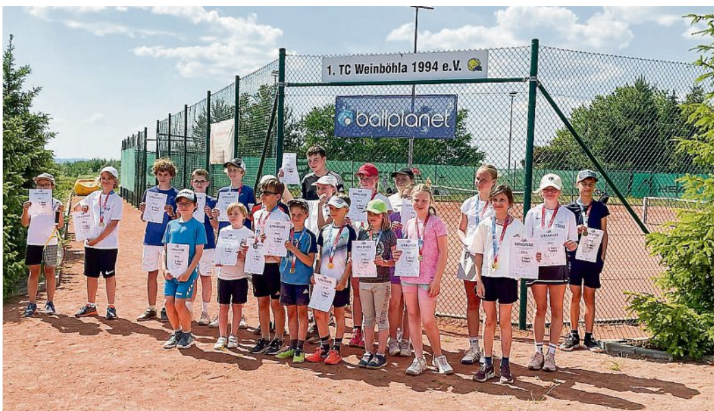
Stolze Teilnehmerinnen und Teilnehmer des Tennisturniers des 1. TC Weinböhla