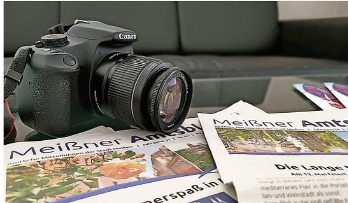
Foto-Wettbewerb fürs Amtsblatt

Vielleicht landet bald auch eines von Ihren Fotos auf dem Amtsblatt?