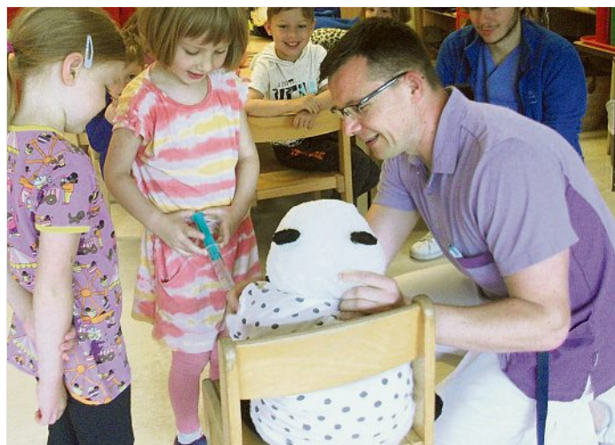
Kinder lernen den Beruf „Pflegefachkraft“ kennen