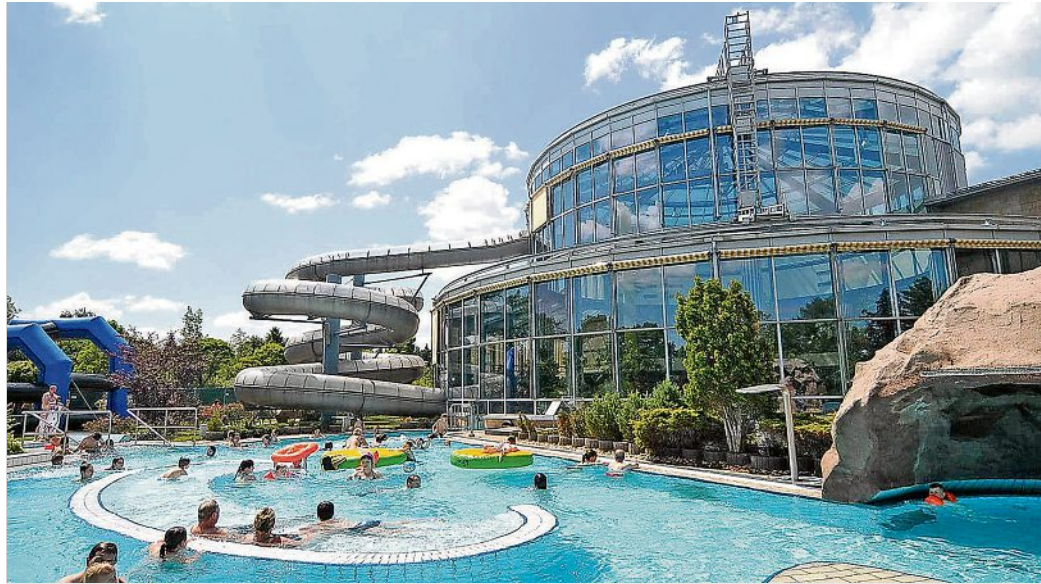
Spiel und Spaß stehen im Meißner Wellenspiel im Vordergrund.

Voll begonnen hat auch die Caravan-Saison. Für Camping-Freunde hält das Wellenspiel Caravan-Stellplätze auf dem Freigelände neben dem Freizeitbad bereit. Der Platz ist seit Jahren sehr beliebt bei den Gästen - mitten im Grünen, umgeben von Bäumen, finden sich hier sonnige und schattige Plätze. So gibt es für jeden motorisierten Gast den passenden Stellplatz. Sozusagen „Urlaub vor der eigenen Haustür“ mit unmittelbarer Ba-