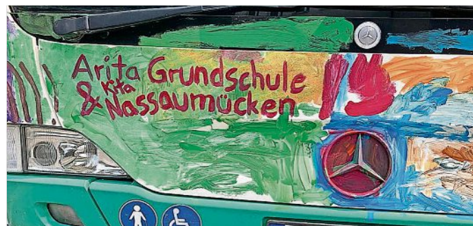
Grundschul- und KiTa-Kinder bemalen gemeinsam den Literatur-Bus

In Vorbereitung auf das Literaturfest wurden wir von der Verkehrsgesellschaft Meißen eingeladen, einen Bus zu bemalen. Die Kinder waren von dieser Idee sofort begeistert und konnten es kaum erwarten, den Pinsel zu schwingen. Der erste Höhepunkt war die Busfahrt bis zur Arita-Grundschule. Dort angekommen, trafen wir auf die Grundschüler, welche den Bus ebenfalls mitgestalteten. Den Kindern wurden Pinsel und Farbe zur Verfügung gestellt und sie fertigten mit viel Kreativität und jeder Menge Spaß ihre Kunstwerke auf dem Bus an. Zurück im Kindergarten erhielt jedes Kind als Dankeschön eine kleine Überraschung überreicht. Die Kin-