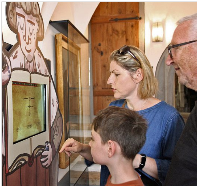
Ferien- und Familienangebote im Dom zu Meissen

Märchenpuzzle (4+) - Figurentheater Cornelia Fritzsche