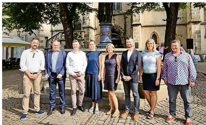
Mitglieder des neugegründeten Vereins „1.100 Jahre Meissen“