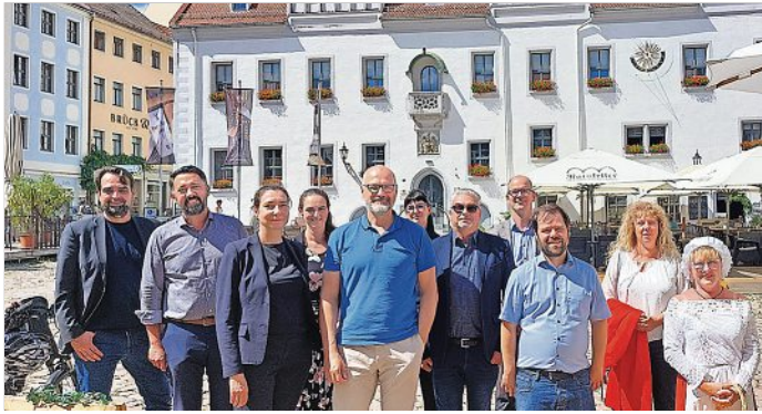
Die Mitglieder des neugegründeten bcsd-Landesverbandes

Sächsischer Landesverband in Meissen gegründet