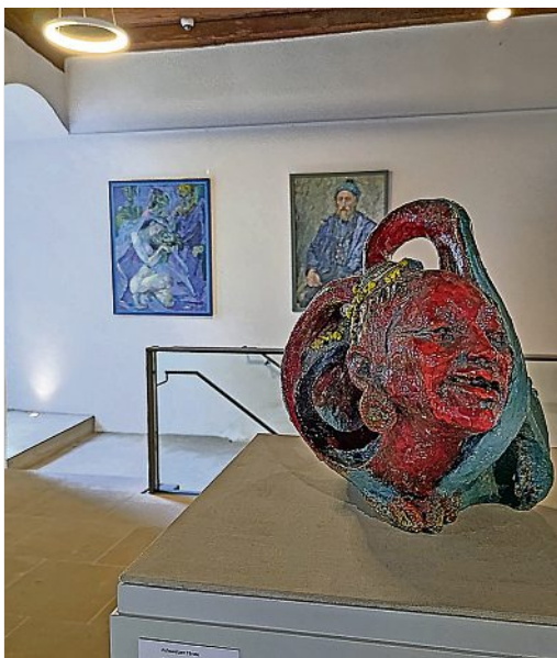
Plastik von Anni Jung

Bis zum 10. August ist im Rathaus eine Ausstellung mit Werken der Meißner Künstlerin zu sehen