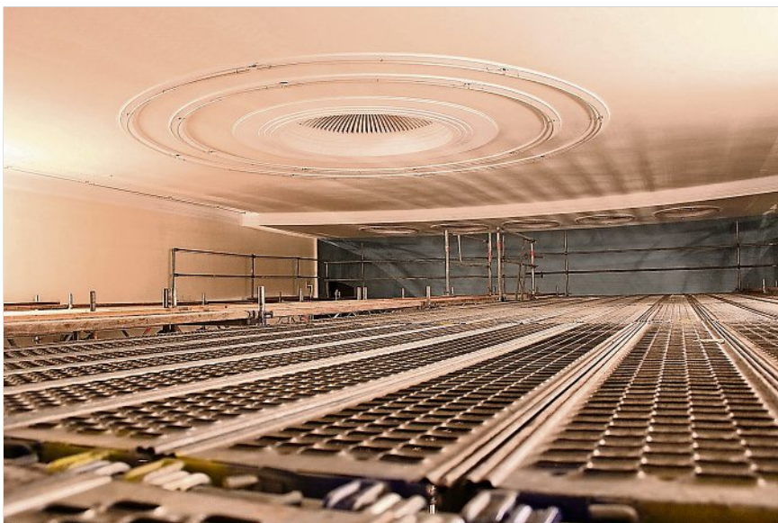
Vorbereitungen zur brandschutztechnischen Ertüchtigung im Theatergebäude.

Die Gebäudeplanung hat das SPV Sachverständigen- und Planungsbüro Voigt aus Meissen übernommen, für die Elektroplanung zeichnet die ETB Technisches Büro Kießling GmbH aus Meissen verantwortlich. Heizung, Lüftung und Sanitär liegen in den Händen der Klett Ingenieur GmbH, NL Meissen und die Tragwerksplanung beim Ingenieurbüro Metzsig aus Meissen. Im Bereich Brandschutz wurde das Büro Brandschutz Thiele GmbH beauftragt.