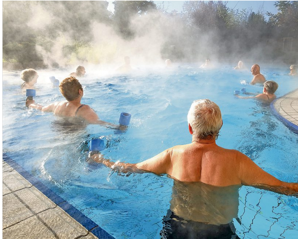
Senioren bei der gemeinsamen Wassergymnastik im Freizeitbad Wellenspiel in Meißen. Fithalten kann man sich hier aber auch beim Saunieren.

Kein Wunder, dass die Saunalandschaft im Wellenspiel inzwischen viele Liebhaber gefunden hat. Sie alle schätzen die positive Wirkung der Sauna auf den ganzen Körper und besonders auf das Immunsystem. Wie wissenschaftliche Studien ergeben haben, leiden regelmäßige Saunagänger seltener unter Erkältungen. Grund hierfür ist vor allem das Wechselspiel zwischen Wärme und Kälte beim Saunabaden. Neben der Haut werden so hauptsächlich die Schleimhäute im Nasen-Rachen-Raum auf plötzliche Temperaturveränderungen besser vorbereitet. Die Sauna wirkt sich außerdem positiv auf das Herz-Kreislauf-System aus.