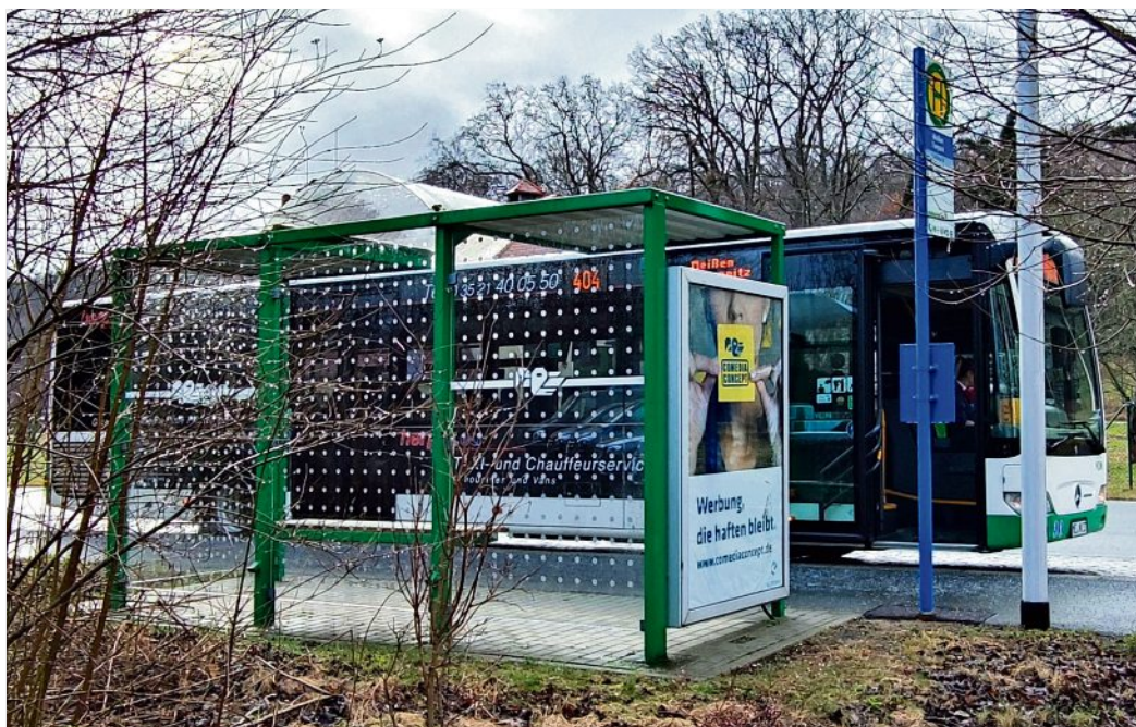
Die Scheiben der Haltestelle Meißen Tierpark sind nun mit Markierungen zum Vogelschutz ausgestattet.