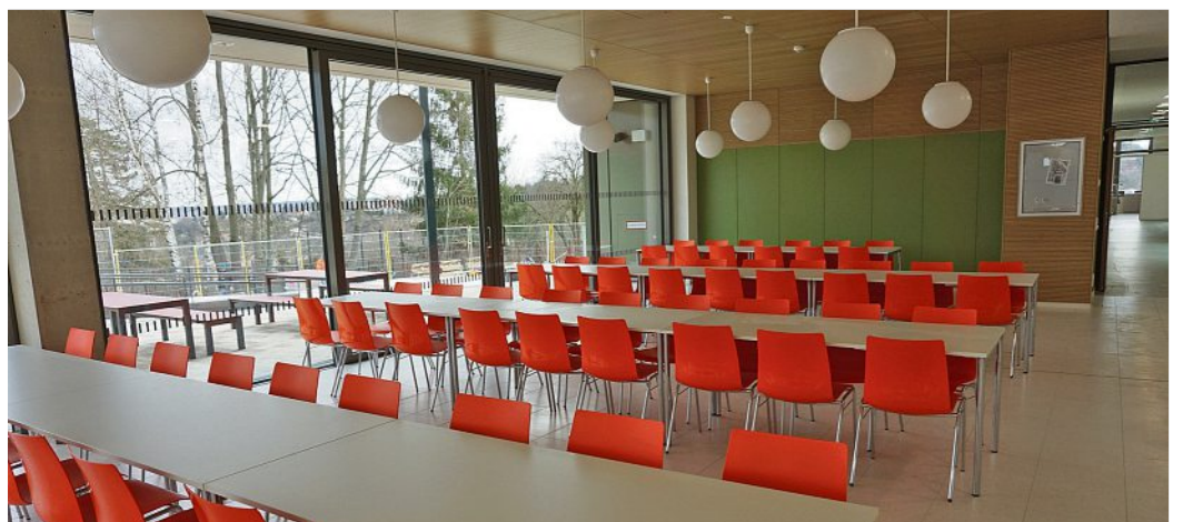
Im Cafeteria-Bereich mit bodentiefen Fenstern und freiem Zugang zum Außenbereich lässt es sich entspannt Mittag essen.