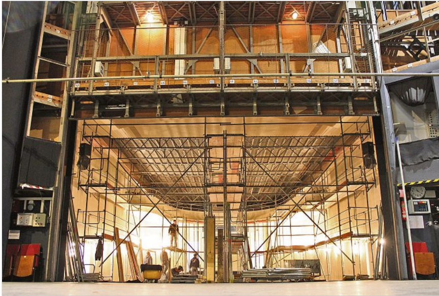
Im Zuschauersaal des Theaters Meissen ist die Saalbestuhlung aufgrund der aktuellen Arbeiten dem Baugerüst gewichen.

In den kommenden Monaten ist im Theatergebäude eine umfassende brandschutztechnische Ertüchtigung geplant