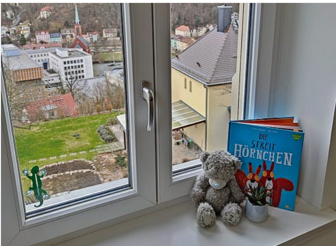
Von ihrer Schule aus haben die Kinder Meißen gut im Blick.