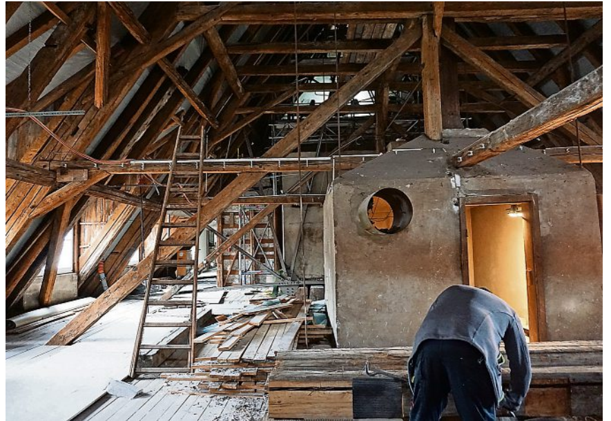
Arbeiten im Dachgeschoss.