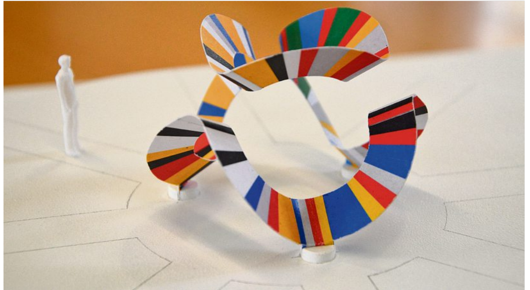
Modell des Gewinnerprojekts „Städteband“ vom Dresdener Künstler Falk Weselsky.

Anstieg der Rohstoffpreise verhindert Umsetzung