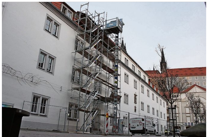
Außengerüst der Baustelle Theater Meissen.