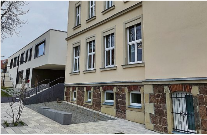
Passen perfekt zusammen: der aufwändig sanierte Altbau und sein moderner Anbau.