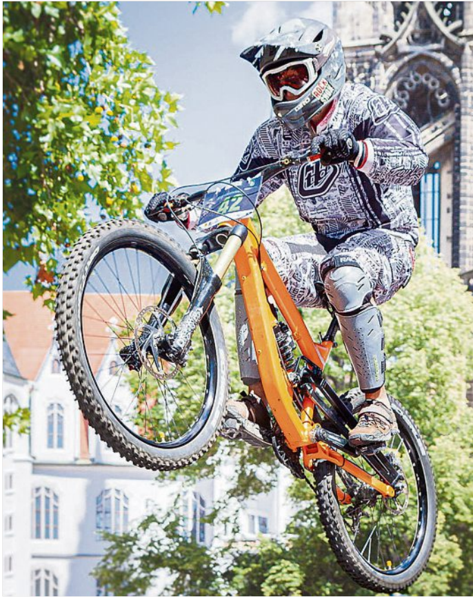
Meißen bewegt beim City Downhill im August.

Nach zwei Jahren voller Ungewissheit hat sich der Gewerbeverein für das neue Jahr so Einiges vorgenommen.