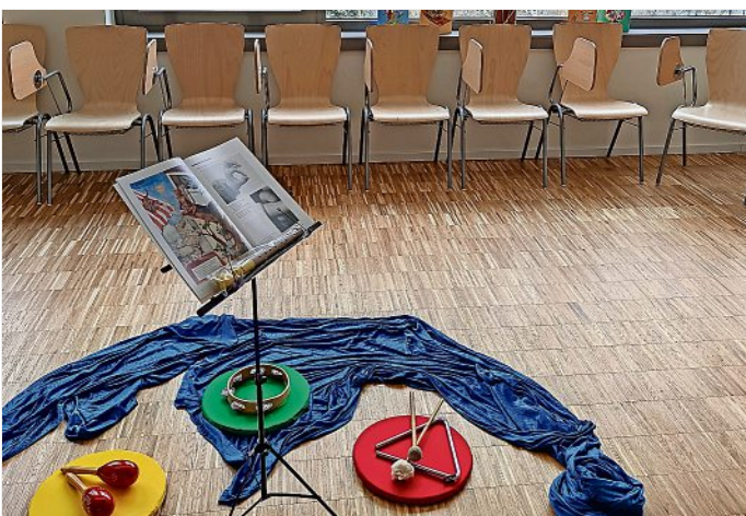
Der funktionale Musikraum lädt zum Singen und Klingen ein.