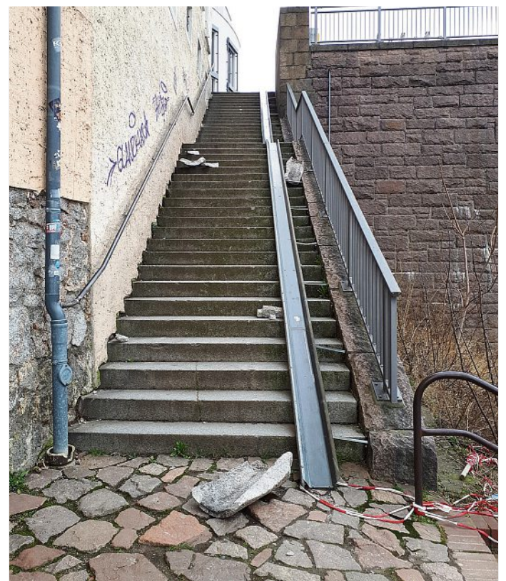
Ein Betonpapierkorb wurde von Unbekannten die Treppe zum Dammweg heruntergeworfen.

von circa 700 Euro zuzüglich der Arbeitsleistung für das Bekleben der Folie und den Einbau der Scheiben. Die an den Haltestellen installierten Betonpapierkör-