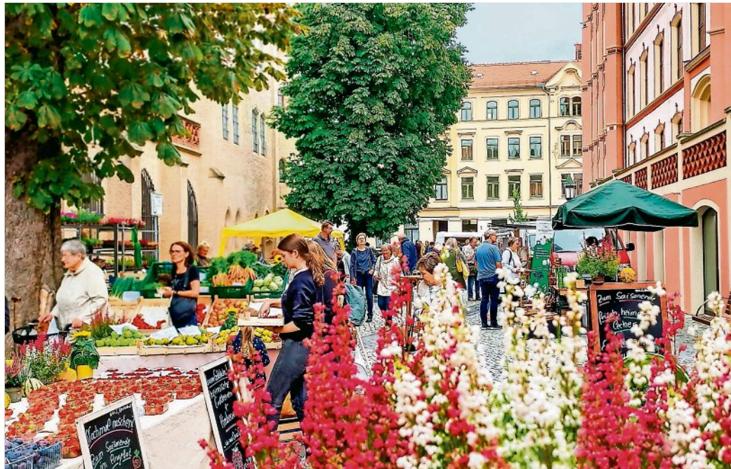
Buntes Treiben auf dem Grünmarkt im Hof der Roten Schule.