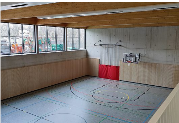
In der modernen Einfeldturnhalle können nach Schulschluss auch Vereine trainieren.