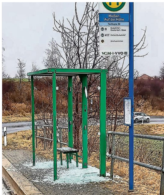
Die zerstörten Scheiben der Bushaltestelle Auf der Höhe wurden mittlerweile entfernt.

Bereits im Dezember letzten Jahres wurden alle Scheiben der Bushaltestellen Auf der Höhe und Jahnstraße ebenfalls mutwillig zerstört. Der Schaden beläuft sich auf circa 700 Euro. Nachdem Ersatzscheiben ange-