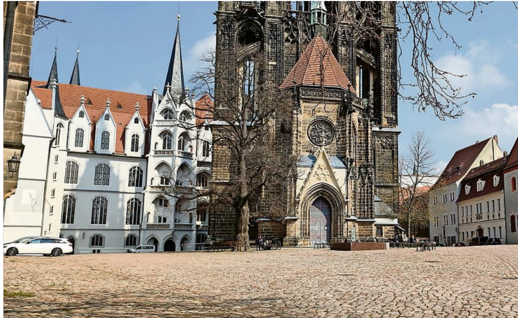
Der Meißner Domplatz soll barrierefrei werden.

Die Zufahrt und der Zugang zum Domplatz ist im Bauzeitraum je-