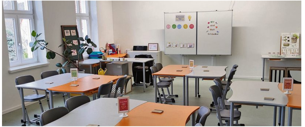
Die liebevoll und individuell gestalteten Klassenräume bieten optimale Möglichkeiten zum Lernen, Lesen und kreativ werden.