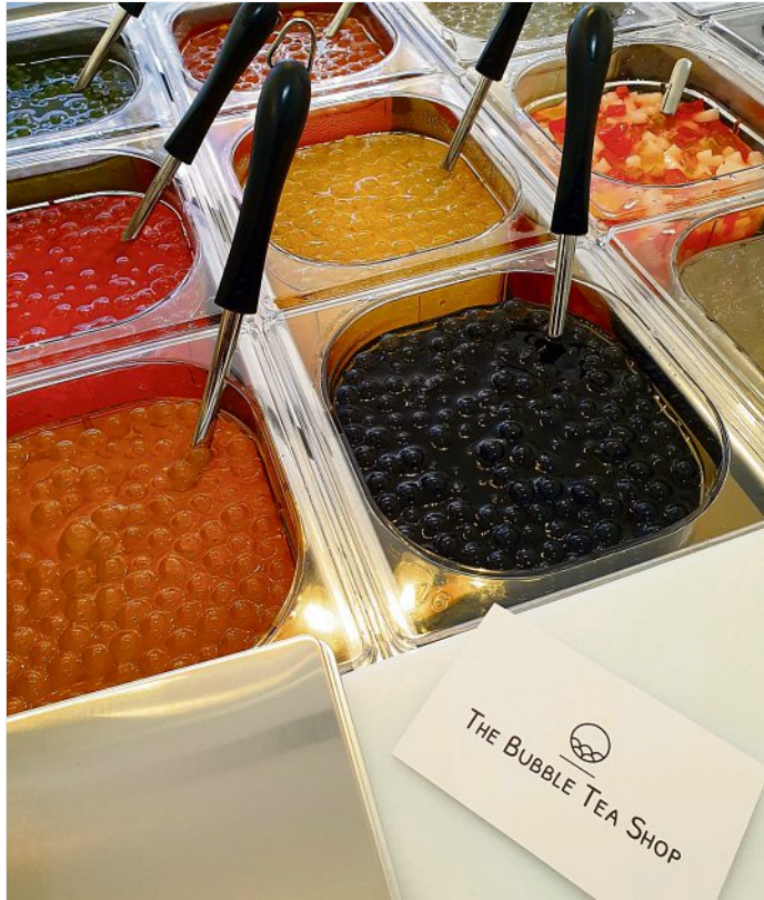
The Bubble Tea Shop bietet eine große Auswahl an Erfrischungsmöglichkeiten.