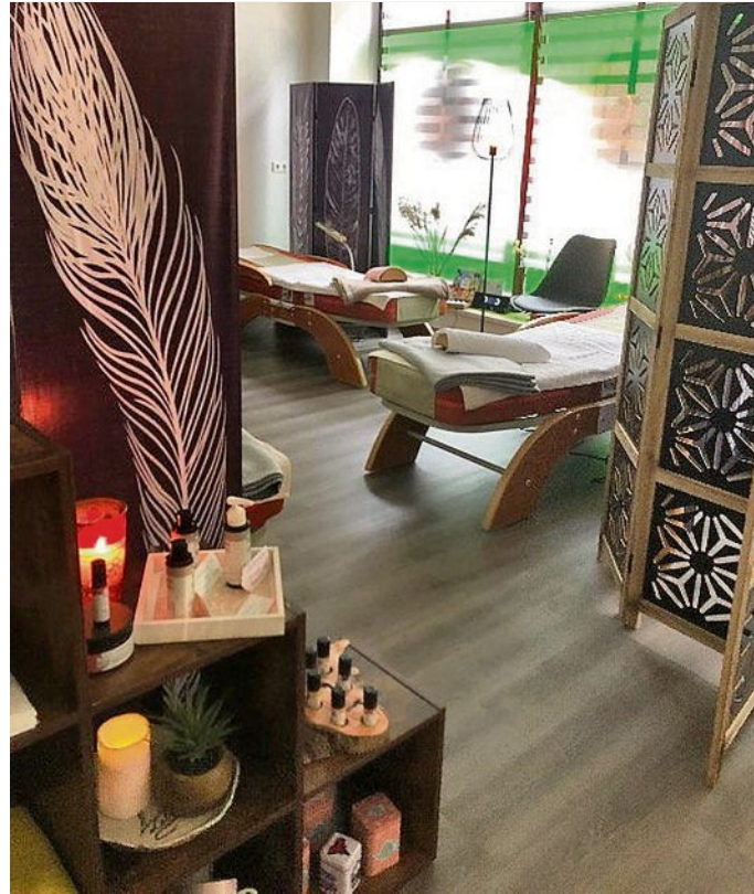
Entspannung pur in der Thermalmassage Vital Meißen.

Thermal- und Fußreflexzonenmassagen auch informative Aloe-Vera-Beratungen an. Schauen Sie vorbei und lassen Sie sich verwöhnen! Extra-Ostertipp: Mit einem Massage-Gutschein können Sie Ihren Lieben