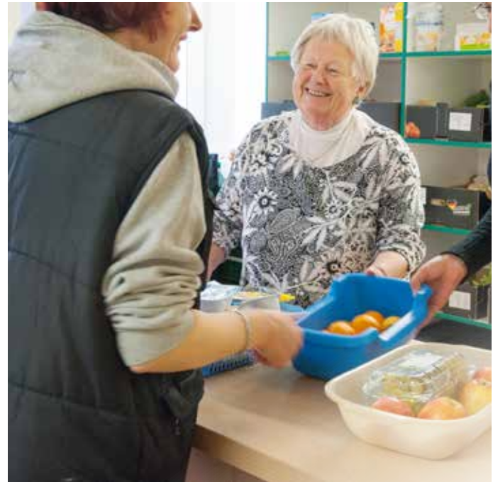
Postkartenaktion 2007 anlässlich des 33.333 Postkartenmotivs

Der Fußweg zur kleinen Dorfschule führte mich bei Wind und Wetter durch urbane Natur. Nach acht Klassen ging ich zur Erweiterten Oberschule. Meine ideologische Einstellung fand dort kein Echo und mir wurde das Leben ziemlich schwer gemacht. So trat ich lieber eine Lehre an, die mich auf die Arbeit in der Firma meines Vaters vorbereitete, denn ich hatte von Kindheit an den Wunsch, die Firma eines Tages zu übernehmen.