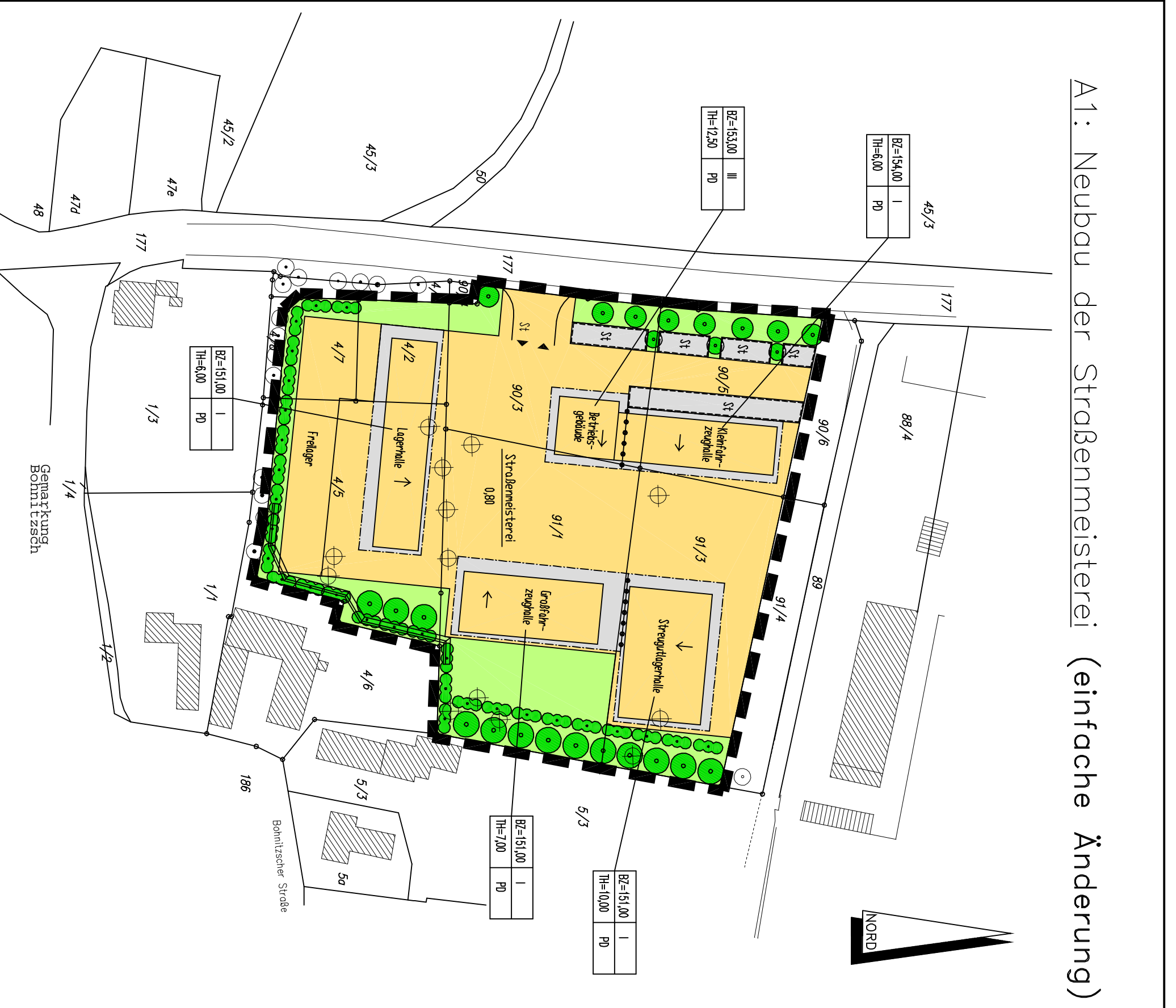
A1: Neubau der Straßenmeisterei (einfache Änderung)